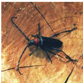
Aromia bungii (Asiatischer Moschusbockkäfer/AMB)