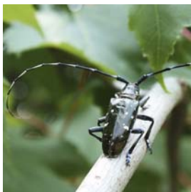
Anoplophora glabripennis (Asiatischer Laubholzbockkäfer/ALB)