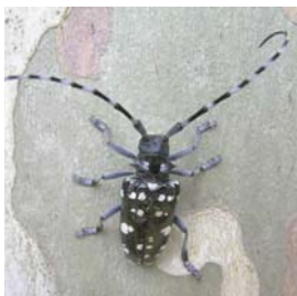
Anoplophora chinensis (Zitrusbockkäfer/CLB)